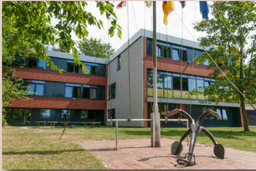
Die Unterbringung erfolgt in einem Trakt in einfachen 4- und 2-Bett-Zimmern, so haben wir Platz für bis zu 22 Personen