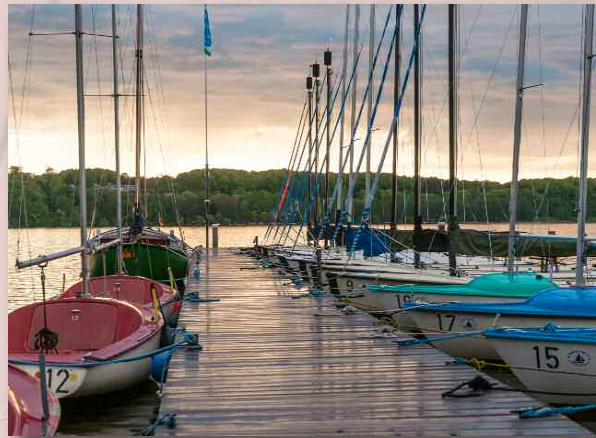
Uns stehen Centauer- und Conger-Jollen sowie Kats zur Verfügung – und sparen Kranen & Trailern