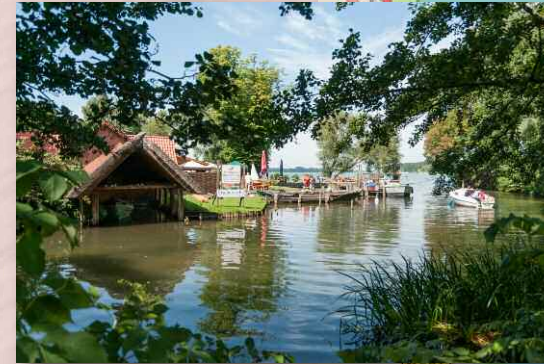
Zu Fuß oder mit den Kanus direkt nebenan erreichbar: Fischer, Eiscafé, Altstadt, Dom, Marktplatz ...

Das Segelzentrum liegt unterhalb des Ratzeburger Doms auf einem von Wasser umgebenen Altstadt kern. Von dort aus öffnet sich der große Ratzeburger See rund 10 km nach Norden. Das Zentrum wurde ursprünglich zusammen mit der nebenliegenden bekannten Ratzeburger Ruderakademie gebaut und mittlerweile als Gemeinnützige GmbH geführt ( www.cvjm-ratzeburg.de ). Der Segelschwerpunkt des vom DSV und VDS anerkannten Zentrums liegt aber weniger auf leistungsorientiertem Spitzentraining als darauf, Schüler (im Norden ist Segeln Schulsport ...), Familien usw. an den gemeinsamen Spaß auf dem Wasser heranzuführen und auszubilden.