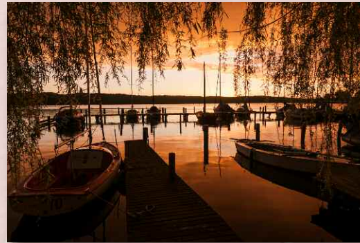
Abends mit einem Getränk direkt vorm Haus im eigenen Hafen sitzen: der schönste Sonnenuntergang am ganzen See