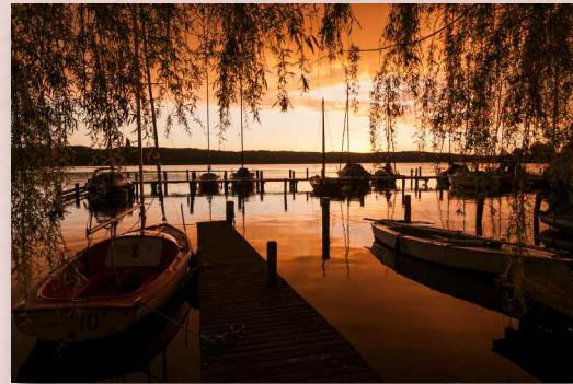
Abends mit einem Getränk direkt vorm Haus im eigenen Hafen sitzen: der schönste Sonnenuntergang am ganzen See