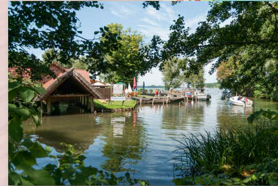
Zu Fuß oder mit den Kanus direkt nebenan erreichbar: Fischer, Eiscafé, Altstadt, Dom, Marktplatz ...

Das Segelzentrum liegt unterhalb des Ratzeburger Doms auf einem von Wasser umgebenen Altstadt kern. Von dort aus öffnet sich der große Ratzeburger See rund 10 km nach Norden. Das Zentrum wurde ursprünglich zusammen mit der nebenliegenden bekannten Ratzeburger Ruderakademie gebaut und mittlerweile als Gemeinnützige GmbH geführt ( www.cvjm-ratzeburg.de ). Der Segelschwerpunkt des vom DSV und VDS anerkannten Zentrums liegt aber weniger auf leistungsorientiertem Spitzentraining als darauf, Schüler (im Norden ist Segeln Schulsport ...), Familien usw. an den gemeinsamen Spaß auf dem Wasser heranzuführen und auszubilden.