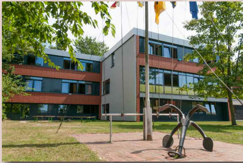
Die Unterbringung erfolgt in einem Trakt in einfachen 4- und 2-Bett-Zimmern, so haben wir Platz für bis zu 22 Personen