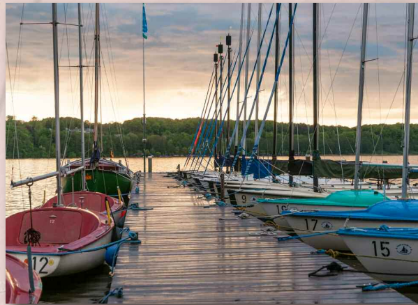
Uns stehen Centauer- und Conger-Jollen sowie Kats zur Verfügung – und sparen Kranen & Trailern